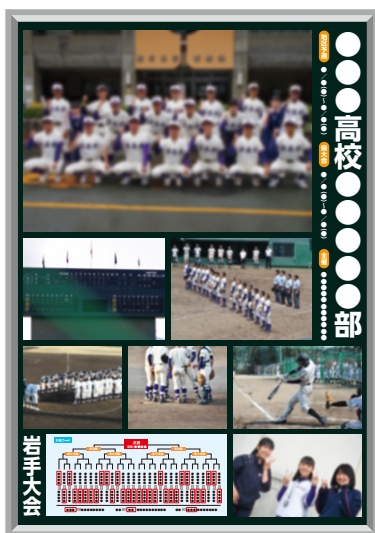
B たくさんの写真 (画像7・テキスト1)