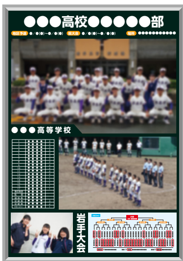
A 大きな写真 (画像3・テキスト2)